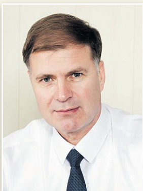
Уважаемые жители Финляндского округа, дорогие соседи, друзья!

Примите самые тёплые поздравления с наступающим 1 Мая – Днём Весны и Труда!